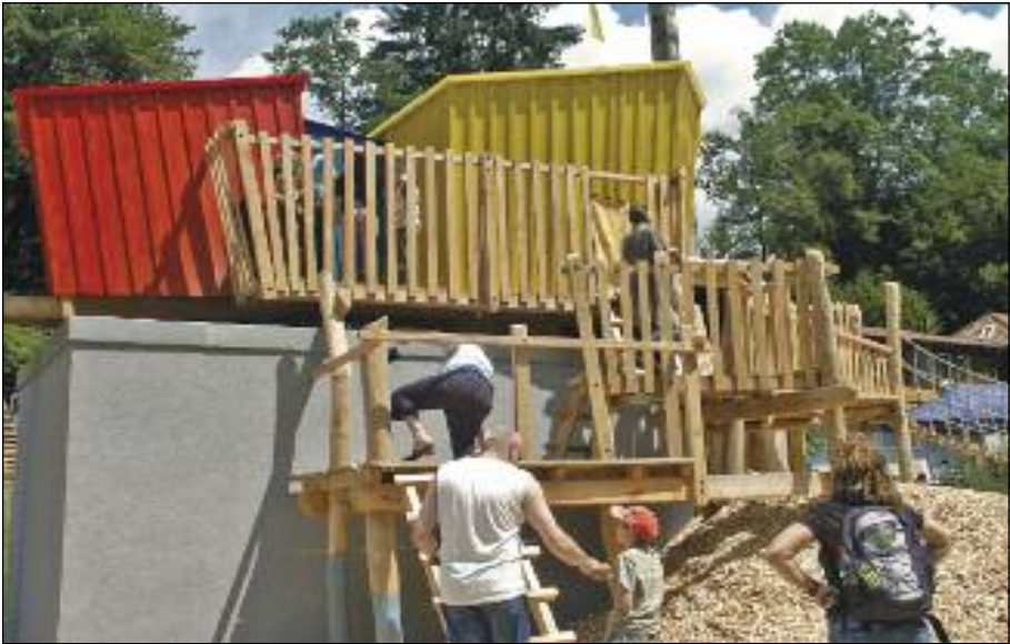
10 Farbräume im Welzheimer Erfahrungsfeld EINS + ALLES