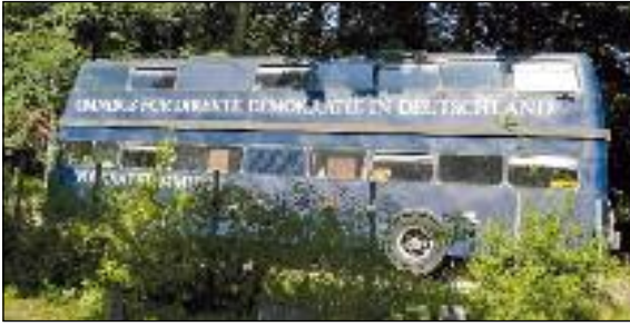
64 Der Omnibus für Direkte Demokratie in Deutschland im Freudenberger Schlosspark

deutscher Demokratie-Geschichte kaum hoch genug einzuschätzen und bietet allein Stoff für Stunden von Betrachtungen.