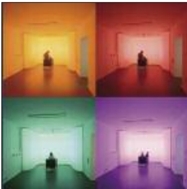
11 Farberleben im sinnereich Rohrbach

Kranke eine Zeitlang intensivem Rot ausgesetzt wurden. Der Herausgeber der naturwissenschaftlichen Schriften Goethes, Rudolf Steiner, entwickelte mit dem Neurologen Felix Peipers, eine Farbtherapie mittels einer blauen und einer roten Farbkammer. Diese und ähnliche Farbheilungs-Methoden werden seit 2003 in einem Projekt unter Beteiligung der Filderklinik und einiger anderer Kliniken untersucht. In den genannten Erfahrungsfeldern steht jedermann diese Erfahrung offen.