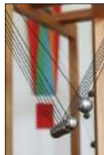
64a Stationen im Freudenberger Schloss