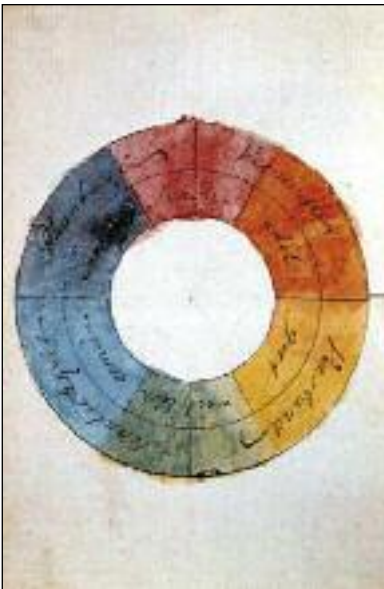
11a Farbenkreis, aquarellierte Federzeichnung von Goethe, 1809, Original: Freies Deutsches Hochstift - Frankfurter Goethe-Museum

In den Worten der Wetzlarer ging es Goethe darum, „wie der Mensch mit dem Licht und seinen Farben umgeht und welchen Gesetzen die Physiologie und Psychologie der Optik