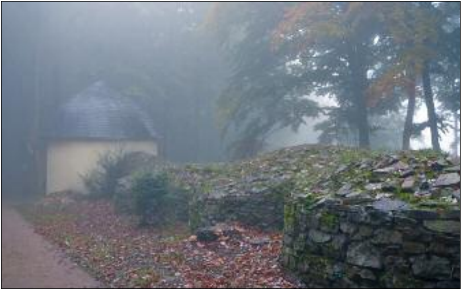
83 Niederwälder Zauberhöhle im Morgennebel

Diese vergleichsweise kleine Anlage wird hier erwähnt als weiteres Beispiel für die schon vor über 200 Jahrhundert Jahren vorhandene Idee, anderen Menschen zu einem Aha-Erlebnis zu verhelfen. Geht man hinter dem Niederwald-Denkmal in Rüdesheim durch den Wald Richtung Bergstation des Assmannshäuser Sessel-Lifts, so trifft man noch heute auf diesen mit beträchtlichem Aufwand erbauten Dunkelgang. Ehemals führte der Graf Karl Maximilian von Ostein seine Besucher durch den dunklen Wald, bis sie vor eine mit Gestrüpp überwucherte Eingangspforte gelangten. Nach dem Durchqueren eines 60 Meter langen vollkommen abgedunkelten Zickzack-Ganges wurde schließlich eine Türe in einen weiteren verdunkelten Raum geöffnet. Nun öffnete der Graf drei Fenster, die den Blick auf Burgen und Kapellen des Rheintals freigaben. Der Zauber des Erlebnisses gab dem Bau seinen Namen. Doch auch heute noch genießen Wanderer den Weg durch die verwinkelten Gänge