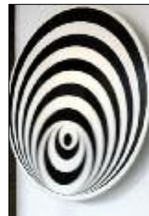
63a Optische Schei- be

Darüber hinaus gibt es hier immer wieder neue