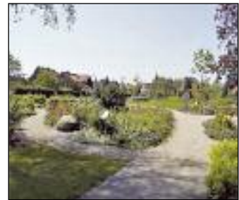
62 Erfahrungsfeld-Stationen im Park des St. Josefs-Hauses

Ein weiteres Erfahrungsfeld innerhalb einer Behinderten-Einrichtung. Weitere Informationen unter St. Josef-Haus gGmbH, Königstr. 1, DE-59329 Wadersloh-Liesborn, Telefon +49-2523/991-0, kontakt@st-josef-haus.de, www.st-josef-haus.de.