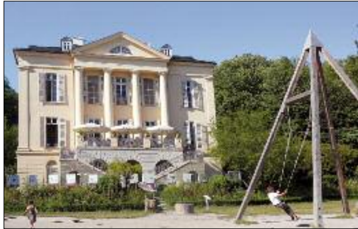
63 Das Freudenberger Schloss mit Café-Terrasse und Partner- schaukel

Das Freudenberger Erfahrungsfeld ist als eines der ersten permanenten entstanden - nach drei mehrwöchigen Veranstaltungen in den Sommern von 1994 bis 1996 ist es seit Ostern 1997 ständig geöffnet. Es besticht vor allem durch die Ästhetik seiner Gestaltung, die einerseits die Schönheit der einzelnen Phänomene herauszuarbeiten versucht und andererseits die Erkenntnisse der Sinnesforschung in die Gestaltung von Räumen und Abläufen einfließen lässt. So werden Erwartungen eines fertig renovierten Schlosses enttäuscht und stattdessen die Ästhetik des Unfertigen zelebriert, weil dies der Entfaltung der Sinne mehr dient. Anstatt oberflächlich mit Informationen überschüttet zu werden, ist man im Schloss eher angeregt, sich selbst ein Bild zu machen.