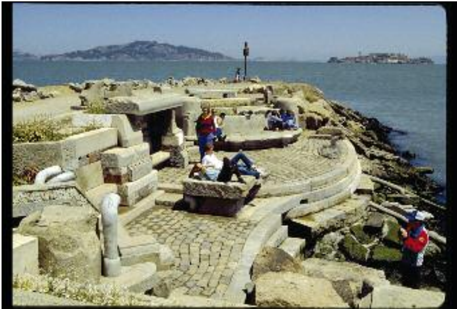
97 Wellen hören am Exploratorium

stehen diese allzu oft nur nebeneinander, als dass das eine das andere befruchtet, doch die Vielzahl von sensorischen Reizen wird dadurch wenigstens in verschiedene Bahnen gelenkt. Der Dunkelgang ist auch hier die meistgesuchte Station – im Exploratorium ist sie zugleich die am meisten Angst machende, denn es wird sehr, sehr eng in den verwinkelten Gängen des „tactile dome“.