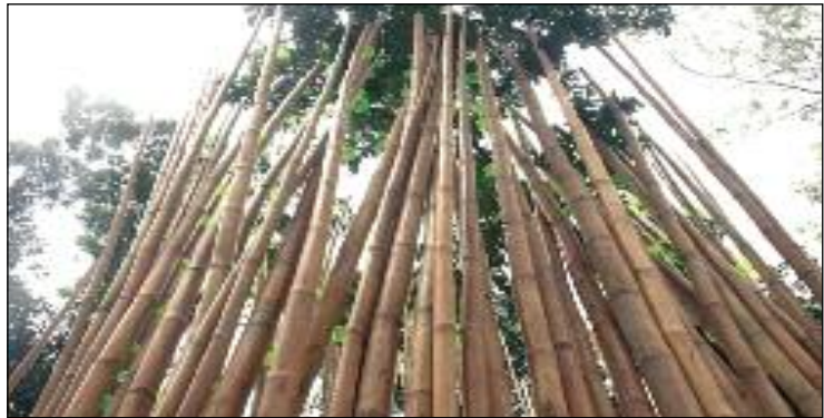
75 Das Vogelnest

2009 als permanente Stätte der Wahrnehmung weiter geführt werden. Dabei war die Stimmung während der Aufbauphase pessimistisch - weder Studenten noch Dozenten noch Besucher der Galerie moderner Kunst interessierten sich für das, was da auf dem Gelände geschah, und so musste schon mit einem Reifall gerechnet werden. Erst später sollte sich heraus stellen, dass alle nur aus lauter gutem Benehmen sich nicht links und nicht rechts zu schauen trauten. Erst als mehrmals deutlich gemacht wurde, dass auch wirklich alles angefasst und ausprobiert werden darf, wurde zum ersten Mal in einem asiatischen Land ein Erfahrungsfeld von der Bevölkerung in Besitz genommen und es wurde klar, welche Freude und Kreativität es auch hier entfalten kann.