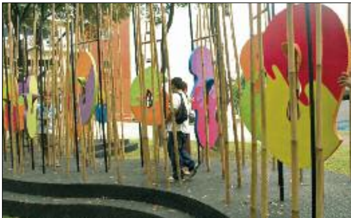
74 Erfahrungsfeld Manila