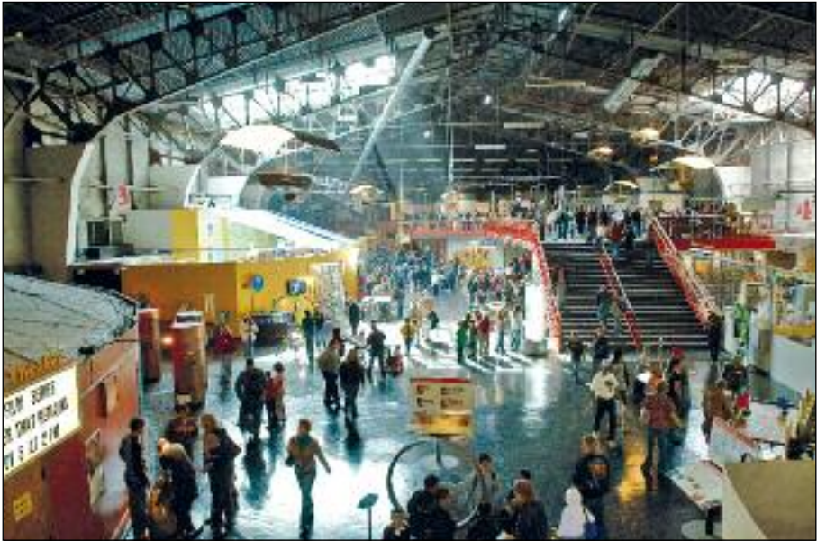
96 Blick ins Exploratorium